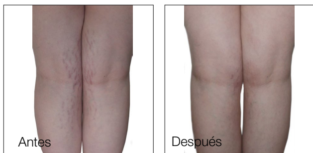
Resultados después de 1 tratamiento