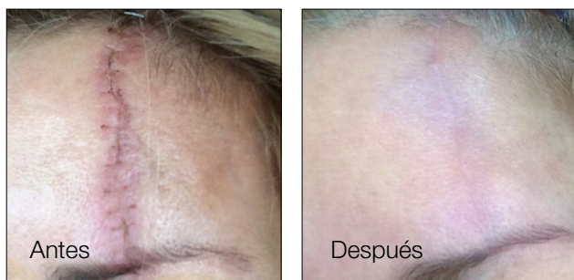
Resultados después de 3 tratamientos