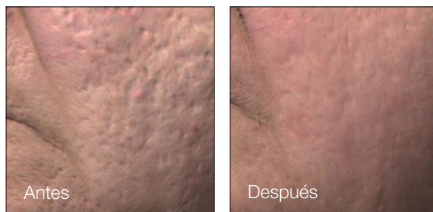
Resultados después de 3 tratamientos