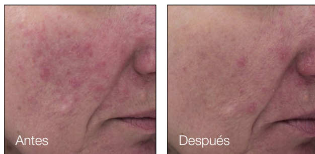
Cortesía de Dinko Kaliterna, MDF Resultados después de 1 tratamiento